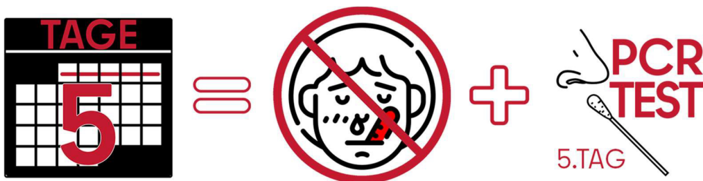
Abbildung 2: Sie sind vollständig geimpft. Das bedeutet, dass Sie zwei Impfungen erhalten haben. Die letzte Impfung haben Sie vor mehr als zwei Wochen erhalten. Wenn Sie nie Beschwerden hatten und sich auch jetzt gesund fühlen, können Sie am 5. Tag einen PCR-Test machen. Wenn das Ergebnis negativ ist, ist die Quarantäne zu Ende. Ansonsten müssen Sie 14 Tage in Quarantäne bleiben.