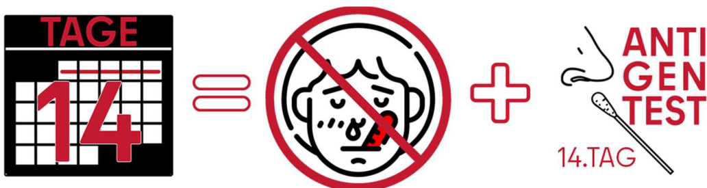
Abbildung 3: Wenn Sie am 13. und am 14. Tag gesund fühlen, können Sie am 14. Tag einem Antigen-Schnelltest machen. Wenn das Ergebnis negativ ist, ist die Quarantäne zu Ende. Ansonsten müssen Sie nochmals 5 Tage in Quarantäne bleiben.